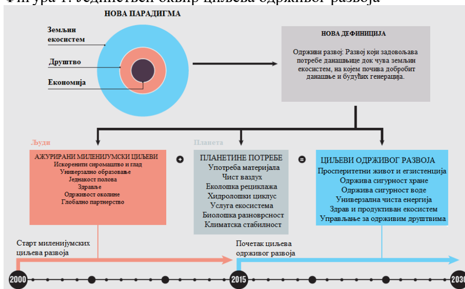
Фигура 1: Јединствен оквир циљева одрживог развоја